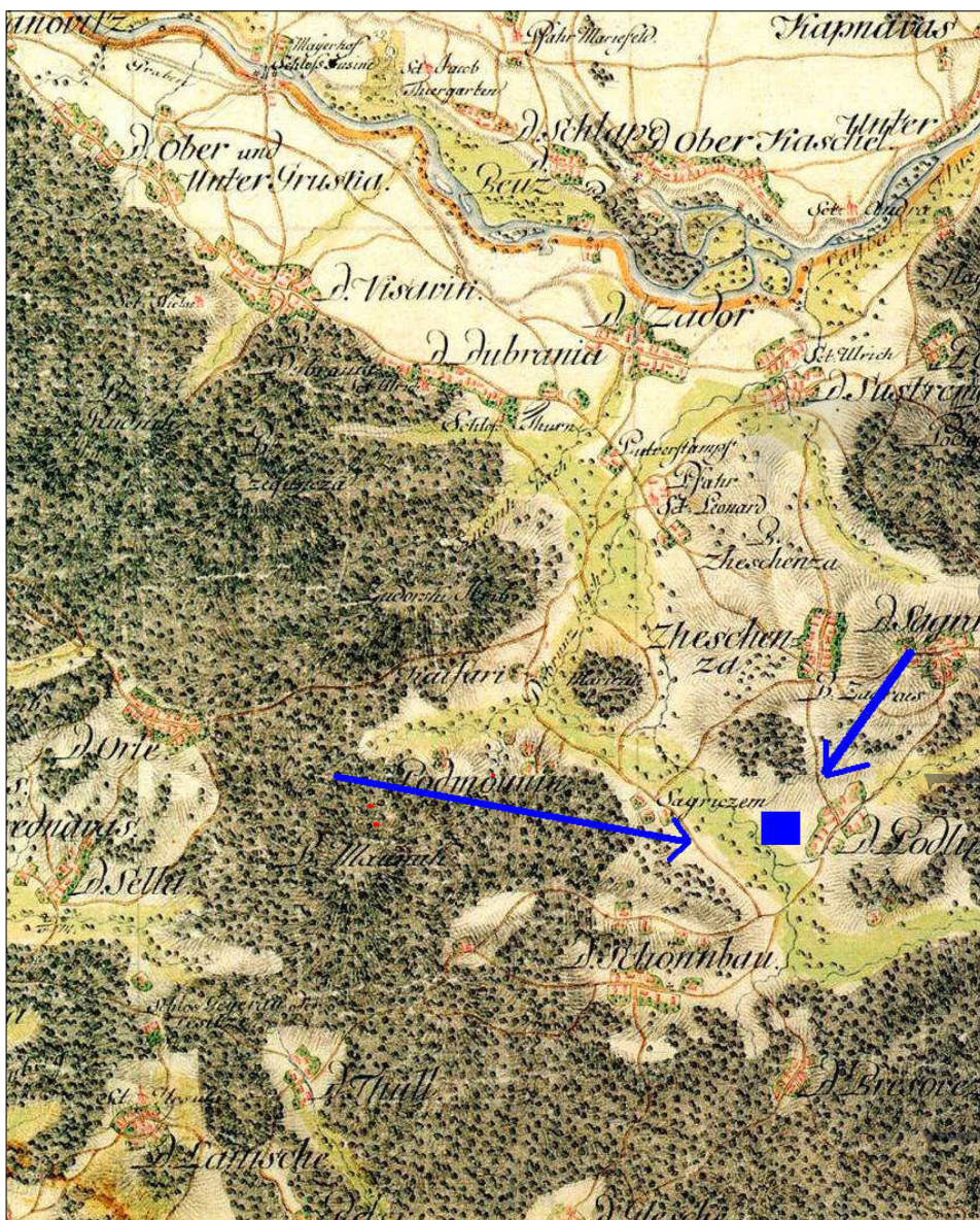
Slika 7: Lokacija grobišča pri Podlipoglavu, gradišče Gradišče in Češnjice ter prometnih povezav na jožefinskem vojaškem zemljevidu. Po Rajšp 1997.

žemo preproste dihotomije staroselci-prišleki, staro-novo, nerimsko-rimsko in pogledamo na kulturne in družbene spremembe v rimskem času onkraj interpretativnih paradigem kot so invazija in upor. 1