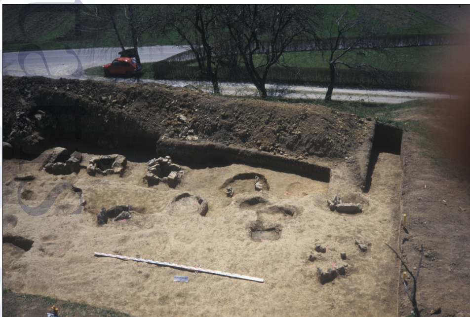
Slika 1: Pogled na izkopno polje med raziskavami.

Arheološko izkopavanje na parc. št. 1252/3 k. o. Sostro je teklo med 7. in 19. aprilom 1997 pod vodstvom mag. Irene Sivec, na izkopnem polju v velikosti 21 x 11 m. V preteklosti so tu že večkrat naleteli na odlomke predmetov iz rimskega časa; nekatere teh so bili izročeni muzeju v hrambo.