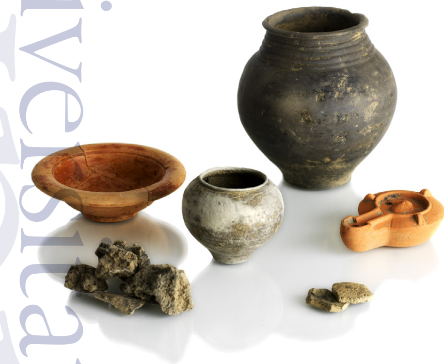
Slika 5: Gradivo iz groba 2: lonec iz temno sivo žgane gline s pripadajočo čašo, uvožena pečatna oljenka, krožnik z rdečim premazom (posnetek sigilate), dva odlomka posode.

življenja povezan z metalurško dejavnostjo, posredno z izkoriščanjem rudnih ležišč v tem prostoru. Ta majhen, a izpoveden predmet povezujemo z najdbo velikega nakovala na Orlah (Stare, 1965, 182) in z rudnimi ležišči na širšem območju Podlipoglava. Glede na te pridatke domnevamo, da je imel mož, pokopan v tem grobu neko posebno vlogo, nek specifičen položaj v svoji skupnosti (prim. grob z Dolenjske ceste, Božič, 2002). Obdelovanje kovine je morda zadržalo svoje prazgodovinske konotacije specializirane aktivnosti, povezane z določenimi rituali.