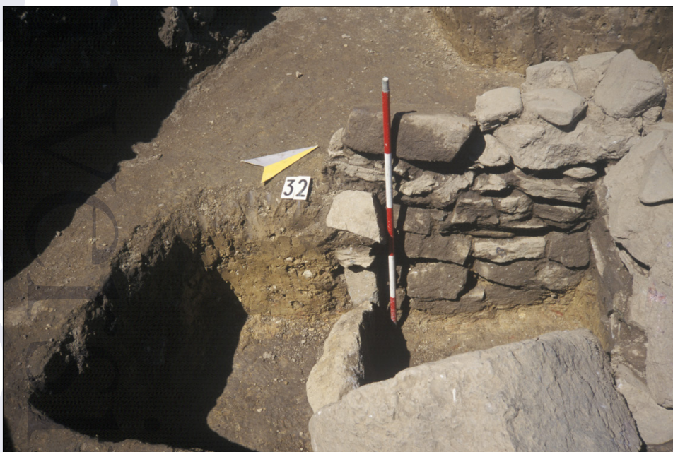
Slika 3: Pokop v zidani grobnici: grob 32 med izkopavanjem.

letja. Ta prav faza oblikovanja grobišča (slika 2) traja od nekako sredine 1. do začetka 2. stoletja: v ta čas lahko postavimo vse pokope v kamnite grobnice, ki jih je moč datirati. Ti se grobovi praviloma pojavljajo v skupinah, v vrsti drug zraven drugega. V drugi fazi, od srede 2. do konca 3. stoletja se zapolnijo prazni prostori med grobovi iz prejšnje faze. Večina grobov sodi v 2. stoletje. V zadnji fazi, v 4. in 5. stol. se pokopavanje v to grobišče opušča: v to fazo postavljamo le tri grobove.