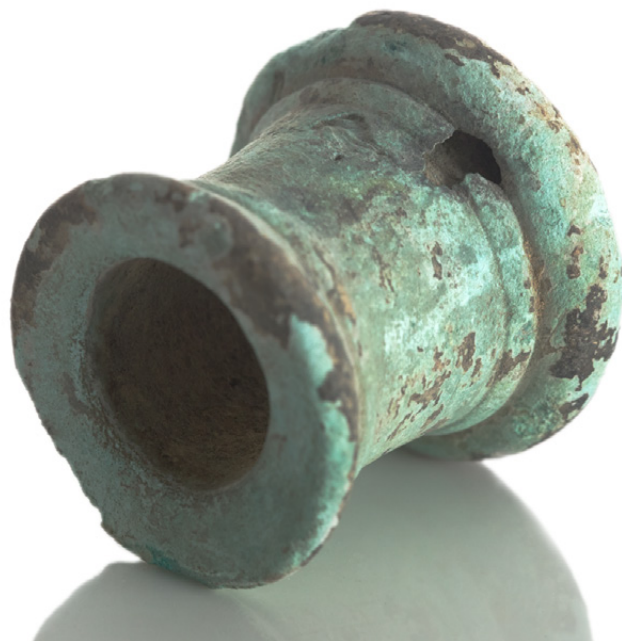
Slika 6a in 6b: Gradivo iz groba 31 ter povečava nakovalca iz istega groba.