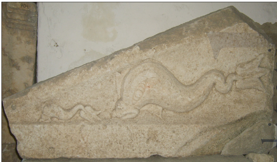
Slika 20: Zgornji del edikule z reliefno upodobitvijo dveh delfinov (PMPO RL 970).

V trikotno oblikovanem vrhnjem delu edikule je relief dveh delfinov; manjši je usmerjen v kot trikotnika, večji delfin je upodobljen za njim (Jevremov, 1988, 107).