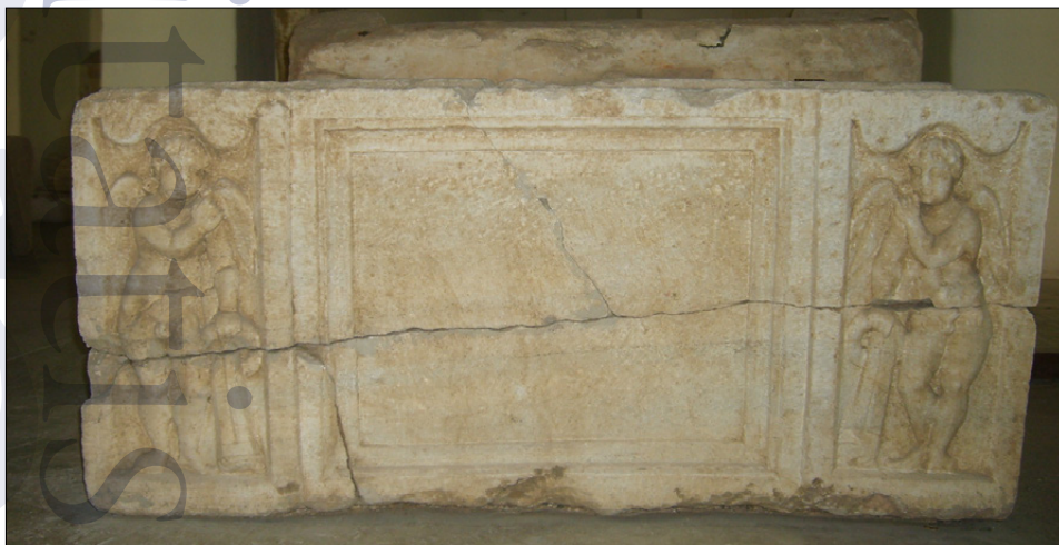
Slika 19: Nedokončana pepelnica z reliefno podobo dveh genijev v stranskih poljih sprednje ploskve (PMPO RL 448).

Nedokončana poškodovana pepelnica ima sprednjo ploskev razdeljeno na tri dele. Stranska polja se zaključujeta z voluto. Reliefa v stranskih poljih prikazujeta drug proti drugemu stoječa gola krilata Genija, ki imata eno roko dvignjeno čez prsi in položeno na nasprotno ramo, z drugo pa se opira na navzdol obrnjeno plemenico. Med njima v sredini je profilirano prazno napisno polje (Jevremov, 1988, 90–91, št. 83).