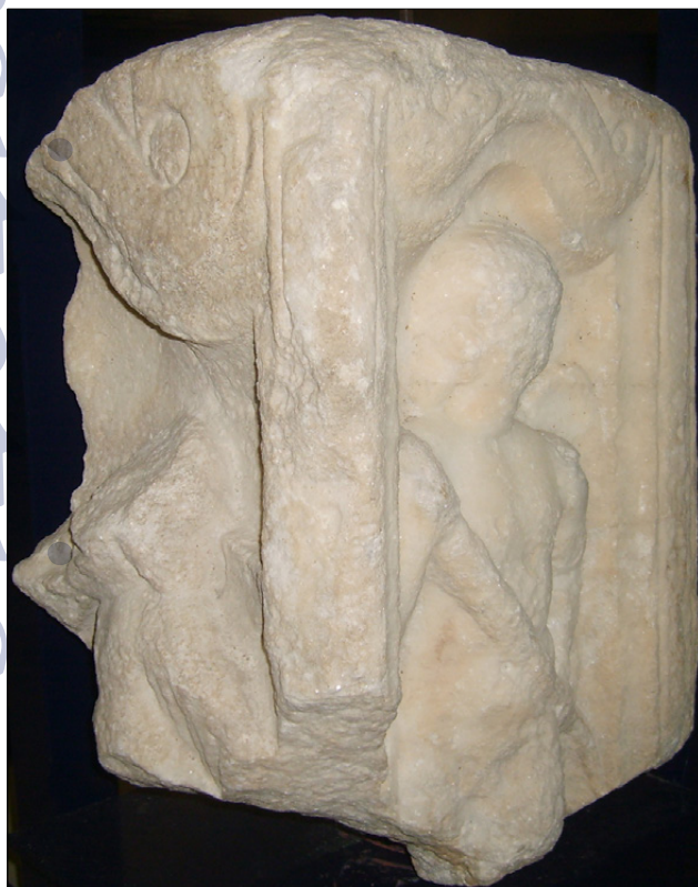
Slika 15: Vogal pepelnice ali sarkofaga s podobo genija pomladi (PMPO RL 463).

Izjemno visoko kakovost petovionskega kiparstva dokazuje podoba genija pomladi, upodobljena na stranskem polju marmornega sarkofaga s Ptuja. Nje-