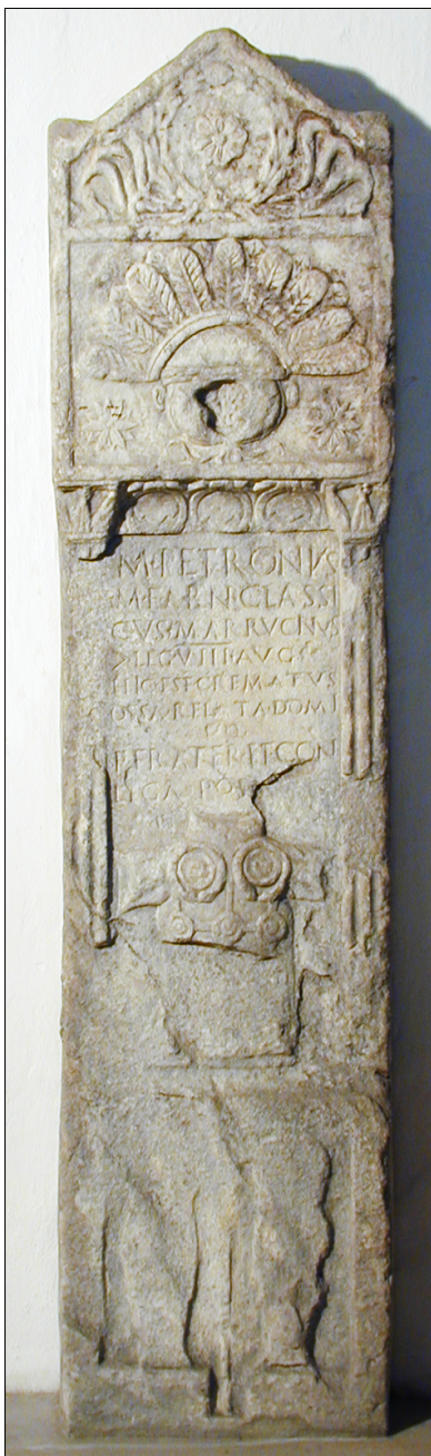
Slika 4: Nagrobna stela, kenotaf, za stotnika VIII. Avgustove legije Marka Petronija Klasika (PMPO RL 825).

mnolomu v okolici Šmartna na Pohorju (Djurić, 2004, 152, 153). Vzidana je bila v ograjo cerkve v Vidmu pri Ptuju.