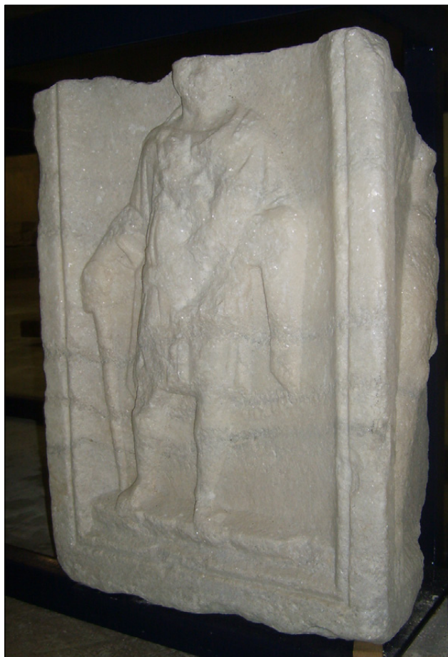
Slika 14: Vogal sarkofaga z reliefnima upodobitvama na sprednji in stranski ploskvi (PMPO RL 883).

Desni sprednji vogal skrinje sarkofaga z reliefno okrašenim stranskim poljem tridelne sprednje stranice in levim delom reliefno okrašene stranske ploskve. V profiliranem sprednjem polju, ki je bilo zgoraj zaključeno z voluto, je relief, ki prikazuje portret pokojnika. Moška figura v kontrapostu, s težiščem