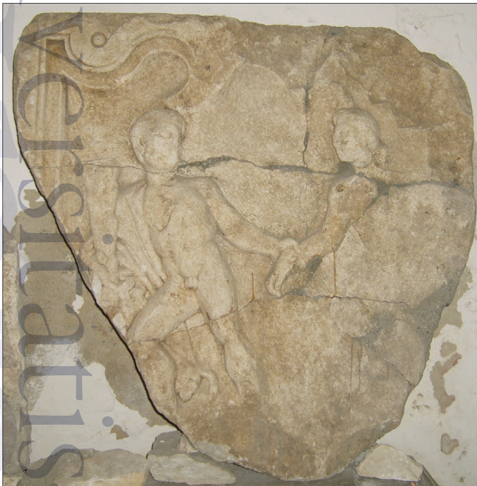
Slika 21: Reliefna plošča edikule z upodobitvijo Herakleja in Alkeste (PMPO RL 969).

z glavo obrnjena proti njemu. Obraz z mandljasto oblikovanimi očmi obkrožajo lasje, ki so zadaj speti v čop. Ostali del reliefa je poškodovan (Jevremov, 1988, 108–109).