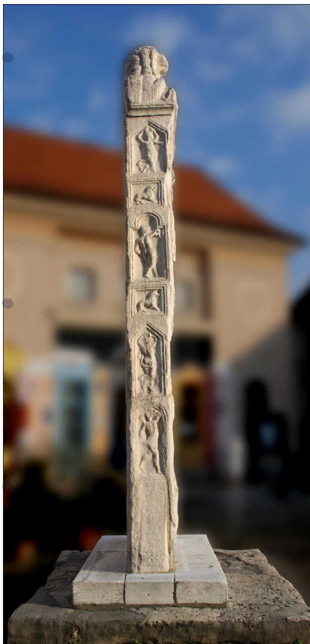
Slika 8: Stranica Orfejevega spomenika s prizori plešoćih moških in žensk v zaključenih poljih.

Oblečen je v orientalsko nošo, na glavi ima trako-frigijsko kapo in igra na liro. Prizor je postavljen v nišo, ki ponazarja votlino. Orfeja pozorno poslušajo živali: slon, jelen, bik, lev, panter, kamela, merjasec, krokodil. Na robu skalne