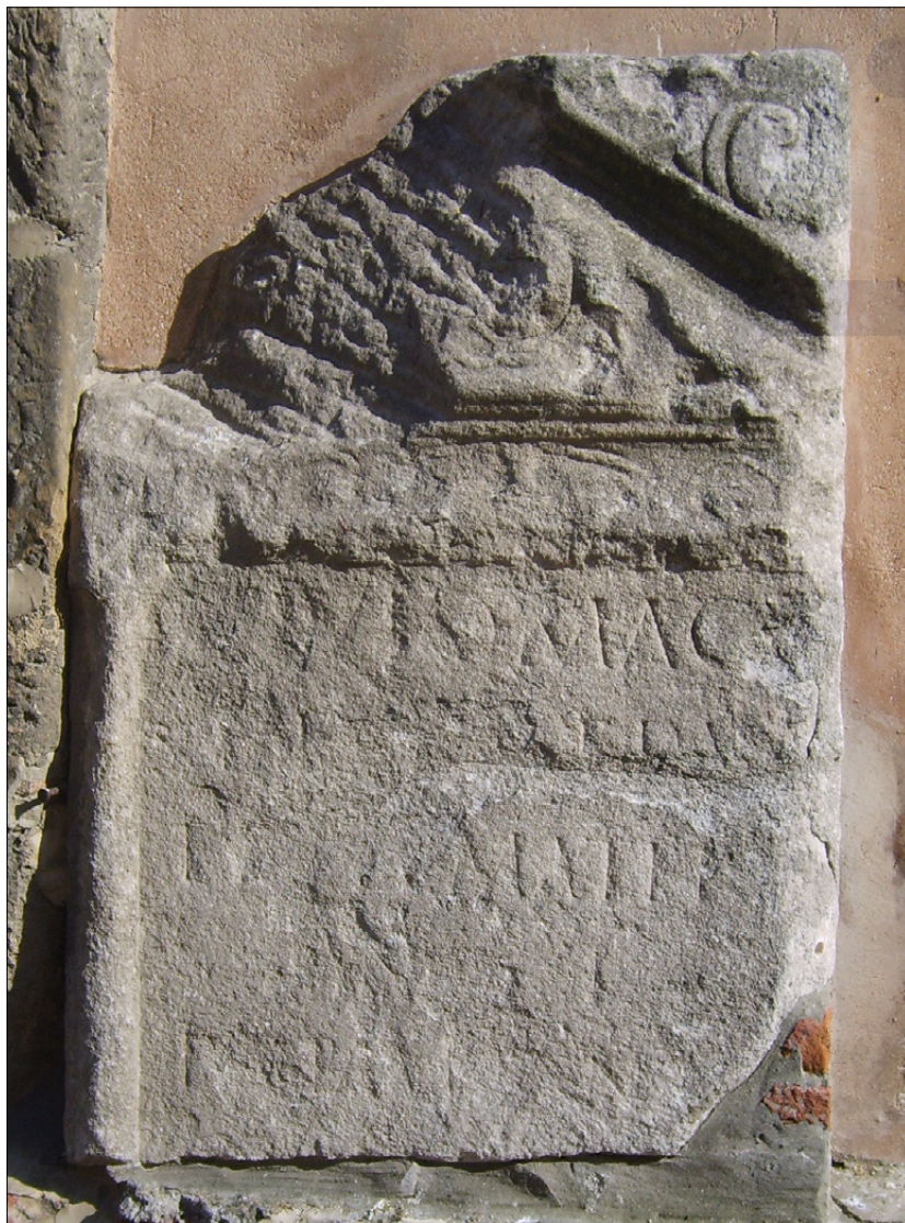
Slika 6: Nagrobna stela, postavljena Gaju Juliju Magnusu, mestnemu svetniku (PMPO RL 774).

Poškodovan zgornji del nagrobnika ima v zaklinkih upodobljena hipokampa, v trikotnem profiliranem timpanonu pa Gorgono med kačami in pticama (goloba). Nad napisnim poljem, ob katerem sta stebrička, je friz z vitica-