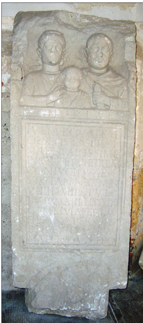
Slika 9: Nagrobna stela Juliji Kupiti, najdena na Panorami leta 1983 (PMPO RL 1033).

votline se na levi plazi kača, prikazana je gos v letu in še neka manjša ptica, na desni opica in dve ptici. Živali so se zbrale in poslušajo velikega pevca (slika 8). 8