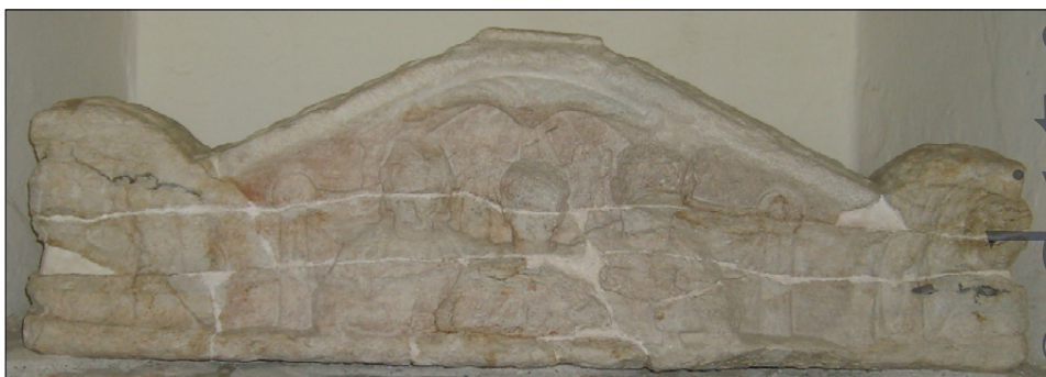
Slika 16: Pokrov pepelnice z upodobljenimi doprskimi družinskimi portreti moža, žene in hčerke (PMPO RL 123).

Ohranjena je sprednja tretjina strehastega pokrova tipične petovionske pepelnice (ossuarium) z velikimi vogalnimi akroteriji in ravnim slemenom. V trikotno oblikovanem polju čela so prikazani doprski družinski portreti moža na desni, žene na levi in hčerke v sredini. Obrazi vseh treh oseb so močno poškodovani in delno odbiti. Moški ima kratko frizuro, oblečen je v tuniko in ogrnjen v plašč (sagum), spet na desni rami s z okroglo sponko. V levi roki drži na prsih svitek. Starejša ženska figura na levi ima značilno frizuro sredine 3. stoletja, oblečena je v tuniko in ogrnjena s plaščem (palla). V desni roki drži na prsih verjetno golobico. Tesno okoli vratu nosi biserno ogrlico. Mlajša ženska figura v sredini ima frizuro močno poškodovano in nedoločljivo. Oblečena je v tuniko, ogrnjena v plašč (palla), v desnici pa drži na prsih verjetno granatno jabolko. Portreti so upodobljeni pred zaveso (parapetasma), ki je na štirih mes-