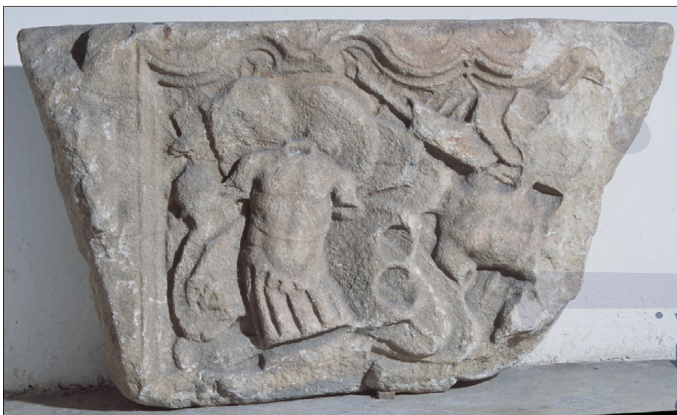
Slika 22: Reliefna plošča edikule z upodobitvijo legionarja z orožjem (PMPO RL 494).