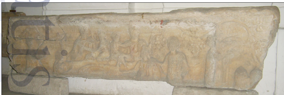
Slika 13: Sarkofag s Hajdine s podobo družinskega obeda v vinogradu (PMPO RL 447).

Zelo znan je prizor z velikega sarkofaga s Hajdine s podobo družinskega obeda v vinogradu. Starši sedijo na počivalniku z visokim naslonjalom, pred mizo s hlebčki kruha na polkrožnem pladnju. Med starši se igra gola otroka, eden od njiju obeša materi venec okoli vratu, drugi sega po očetovih odlikovanjih. Večji otroci v vsakdanji obleki pristopajo k mizi, da bi se udeležili obeda. Strežnici prinašata kozarce in skodele z leve strani. Okoli prizora in zgoraj so