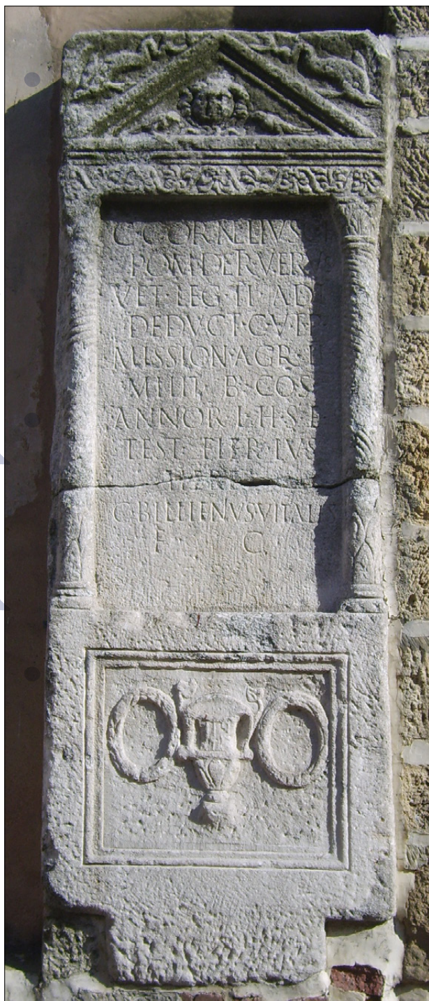
Slika 5: Nagrobna stela, posvećena Gaju Korneliju Veru (PMPO RL 773).