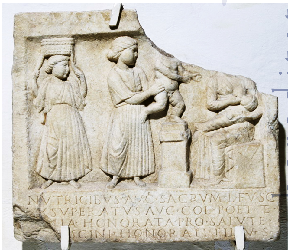
Slika 2: Marmorna plošča z reliefom Nutrices Augustae s Panorame (PMPO RL 973).

Obrtniške dejavnosti s stavbami vred na območju Rabelčje vasi so počasi zamirale, isto pa je bilo značilno tudi za sosednji Panoramo in Vičavo. Mesto je izgubljalo značaj provincialnega središča Panonije, opuščeni prostor je postal uporaben le še za kratkotrajne obrtniške dejavnosti in pokopališča.