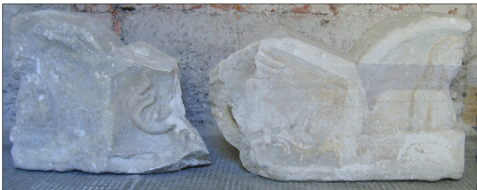
Slika 11: Akroterija strehastega pokrova sarkofaga z upodobitvijo letnih časov (PMPO RL 1016).

Ohranjena sta dva kosa z reliefi, okrašenega strehastega pokrova sarkofaga z akroteriji. Nekoč so predstavljali vogali pokrova s svojimi podobami štiri letne čase. V peterokotni niši stranske ploskve je rastlinski ornament, v vogalu polkrožno oblikovanega akroterija pa doprsna podoba kodrastega mladeniča, genija poletja, ob katerem je v višini njegove desne rame posoda na nogi s štirimi žitnimi klasi. Tudi peterokotna niša stranske ploskve drugega kosa je okrašena s v snop povezanim razvejanim rastlinskim ornamentom (podobnim bakli?), nad katerim je upodobljen še del peruti. V vogalu akroterija je doprsje kodrastega mladeniča, genija jeseni. V posodi na nogi ob njegovi levi rami so sadeži (Tušek, 1993b, 204–207).