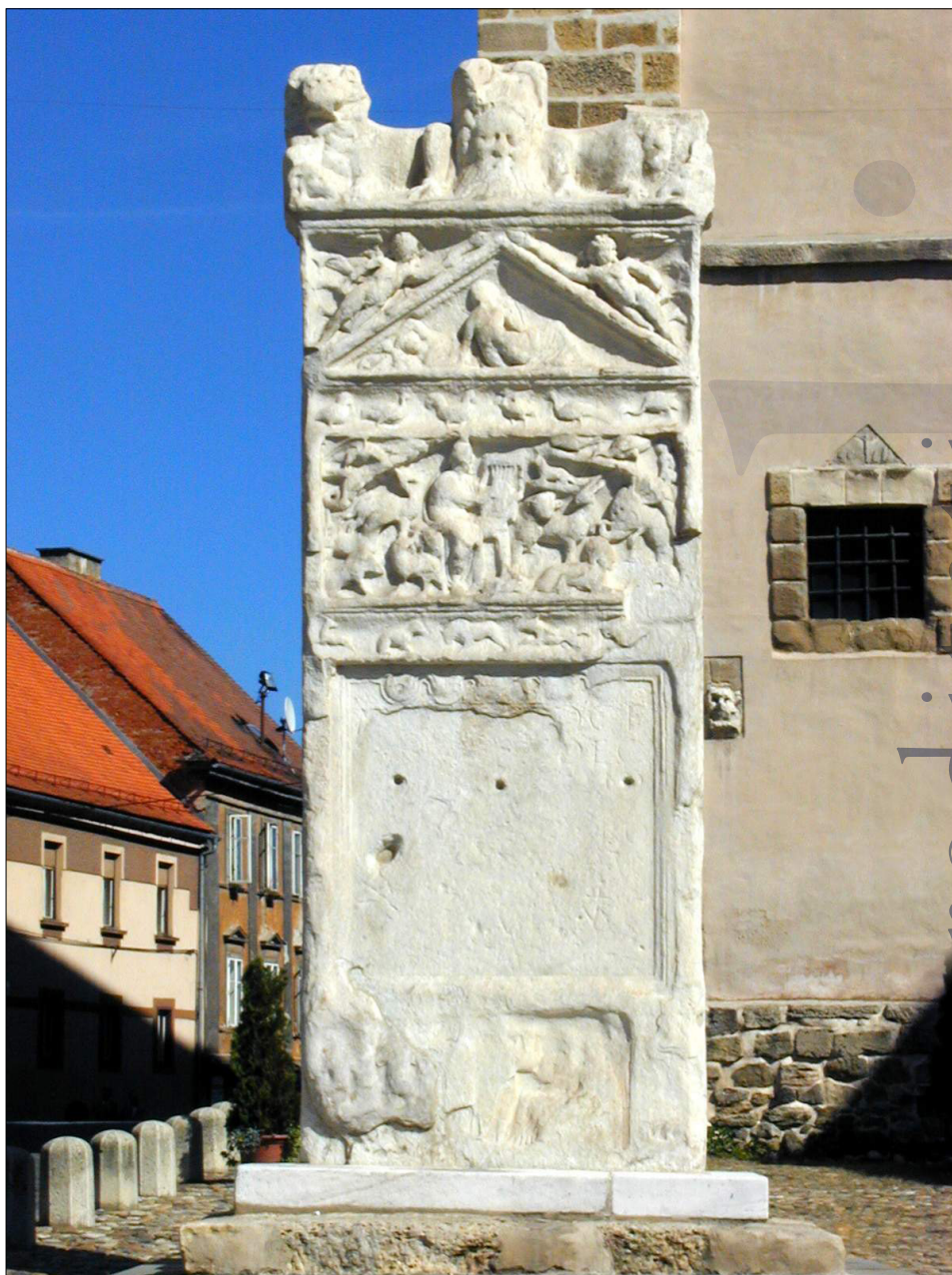
Slika 7: Orfejev spomenik, nagrobna stela, posvečena Marku Valeriju Veru (PMPO RL 769).

V glavnem polju, obdanem z dvema stebroma z luskasto površino in okrašeno z nekakšnimi stiliziranimi listi, sedi na sredini na desno obrnjen Orfej.