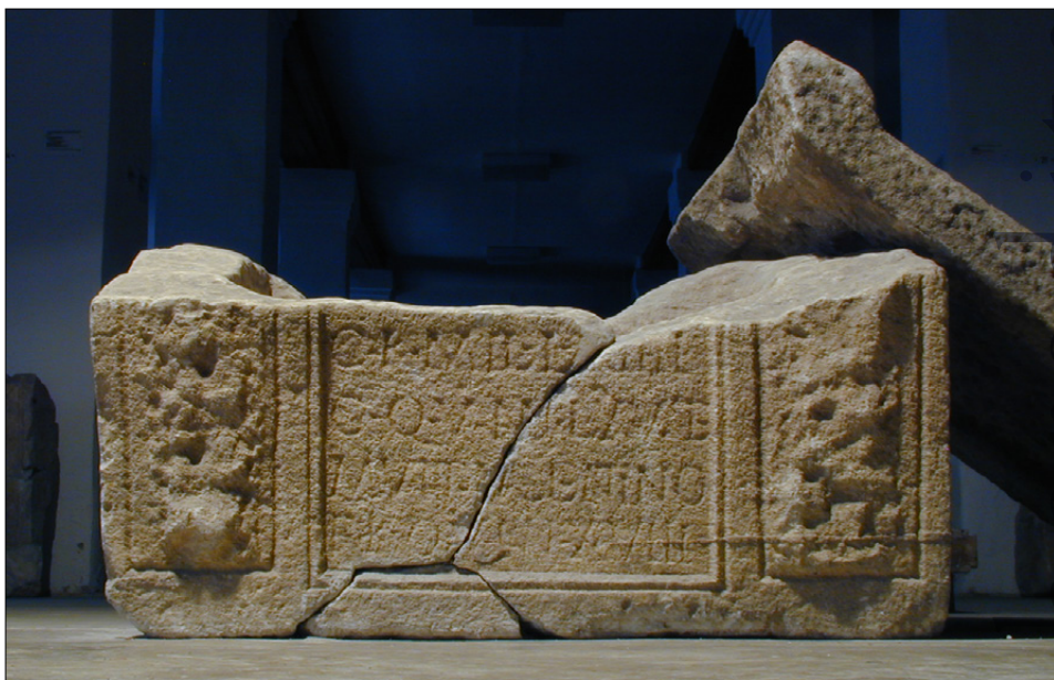
Slika 18: Nedokončana pepelnica z napisom (PMPO RL 36).

Sprednja stran je razdeljena na tri dele. Stranska polja sta nevesče obdelana oziroma nedokončana. Med njima je napisno polje z enostavnim okvirom, v katerem je ohranjen del napisa: C(ONIUGI) · K(ARISSIMO) · MIL(ITI) · L(EGIONIS) · XIII / G(EMINAE) · Q(UI) · V(IXIT) · ANN(OS) · LXV · ET / MUNAT(IO) · VALENTINO / F(ILIO) · C(ARISSIMO) · Q(UI) ·