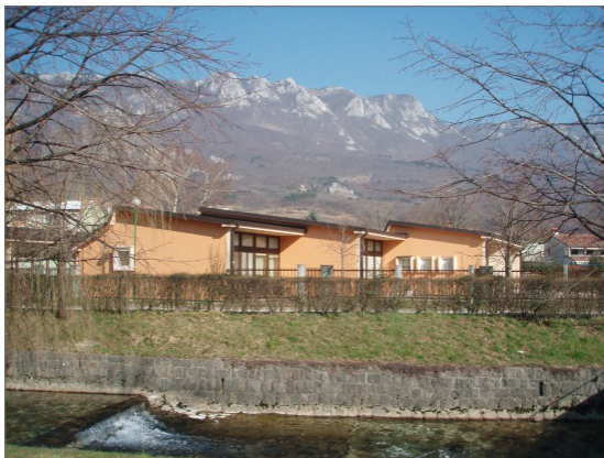
Slika 1. Ajdovščina (Šturje) – lokacija otroškega vrtca na levem bregu reke Hubelj.

Opis: Na parceli št. 632/1, k.o. Ajdovščina so našli temelje zidu iz večjih prodnikov. Spričo najdb v ruševinski plasti na obeh straneh domneva-jo ostanek lesene, z opeko krite stavbe, na nizko zidanih temeljih. Najdb je bilo malo. Prevladuje keramika (amfore, domači lonci z metličastim okrasom), kos rdeče žgane kadilnice, kos imitacije terre sigillate , precej steklenih drobcev, predvsem čaš, nekaj drobnih bronastih predmetov ter 5 slabo ohranjenih novcev (2 folisa Konstan-cija II., ostali le okvirno datirani v 4. stoletje). 5