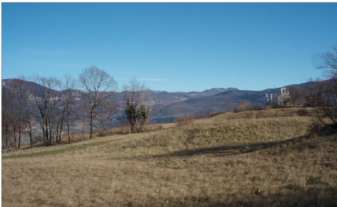
Slika 4. Planina – Gradišče s cerkvico sv. Pavla.

z zahodne strani skozi zaselka Koboli in Gornja vas. Utrjena je le zahodna stranica gradišča s 400 m dolgim obrambnim nasipom, ki je pri tleh širok 10 m in povprečno 4 m visok. Obrambni nasip, imenovan tudi Šance, je ohranjen v celoti, presekani le z dvema kolovozoma. 36 Na južni strani še en krajši nasip z zaključkom manjšega obzidja zapira manjšo planoto – zgornje gradišče. Domnevno je bil tu del naselbine ali pribežališče v sili. Zahodno od podružnične cerkve sv. Pavla so naleteli na temelje neke antične utrdbe. Tik pod rušo so našli številne kose rimske opeke in lončenine. 37 Da je bila tukaj tudi močno utrjena rimska postojanka, katere ostanki, sodeč po podatkih v literaturi, so bili vidni še konec 19. stoletja, piše Rutar in Premerstein. 38 V notranjosti gradišča