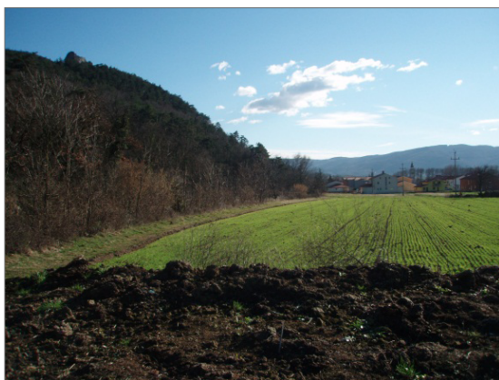
Slika 5. Vipava – območje ob strugi Bele med Vipavo in Vrhpoljem.

od Vipave, ob strugi Bele, v mlajšem rimskem času gospodarski (obrtni?) okoliš. 49