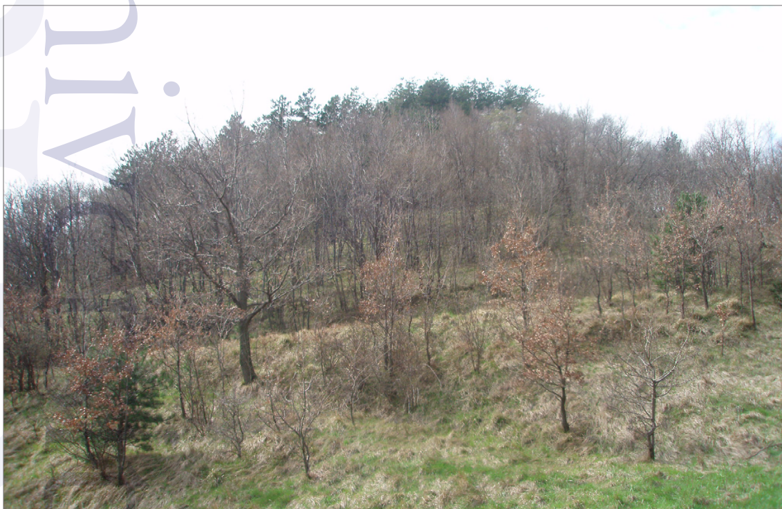
Slika 3. Gradišče nad Hraščami – zahodno pobočje.