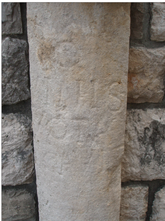
Slika 8. Sanabor – miljenik, vzidan v pokopališki zid pri cerkvi sv. Danijela.

genijem, v kateri je, po legendarnem izročilu s pomočjo vipavske burje, zmagal Teodozij, zagovornik krščanstva. Do sedaj je bila najdena zgolj železna podkev na njivi (parcela št. 2263 k.o. Vrhpolje) ob cesti v smeri proti Vrhpolju, severovzhodno pod gradom Zemono, ki bi lahko kazala na burno dogajanje v pozni antiki. 69