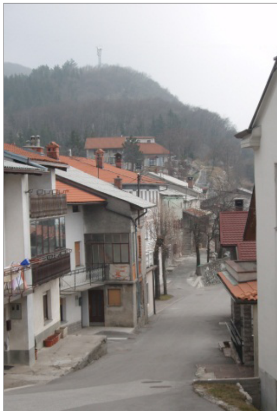
Slika 2. Col – trasa stare ceste, kjer je bila v 16. stoletju zapora Podvelb, v ozadju Šance.

Zdrobljeno kamenje so rabili za gradnjo cest. 16 Skalni previs, utrjen z opisanim kamnitim okopom šance, je pogosto najdišče staroveških predmetov iz železa in bron, kot so podkve, osti sule in drugo.