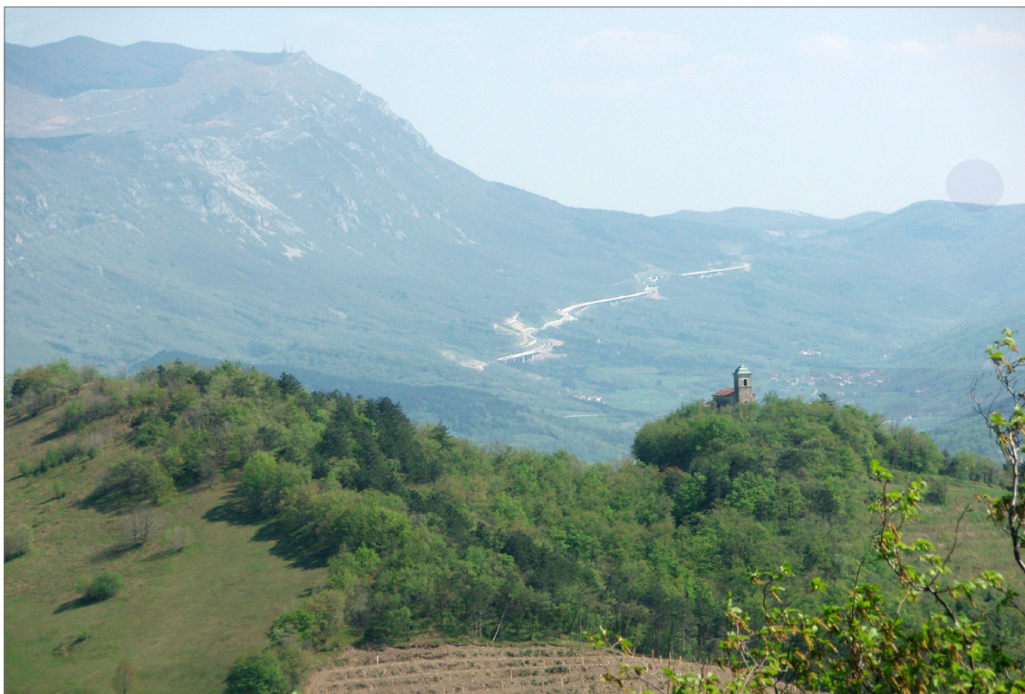
Slika 7. Prehod čez Razdrto (pogled iz Erzelja).

ta čez Hrušico je imela tudi določene slabosti. Zaradi velike poraščenosti z gozdom so tu prežale nevarnosti. Na to kaže nagrobnik Antonia Valentina, poveljnika 13. legije, ki so ga ubili roparji na mestu Scelerata, najden v Ajdovščini 59 . V zimskih mesecih je poleg tega veliko težavo predstavljal sneg. Zato so v 1. ali 2. stoletju n. š. popravili starejšo prometnico preko Razdrtega in jo poimenovali zimska cesta. 60